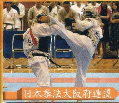
日本拳法大阪府連盟