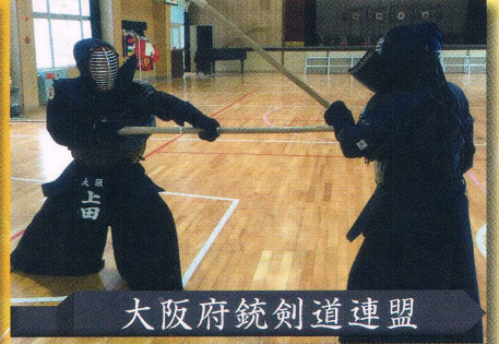
大阪府銃剣道連盟