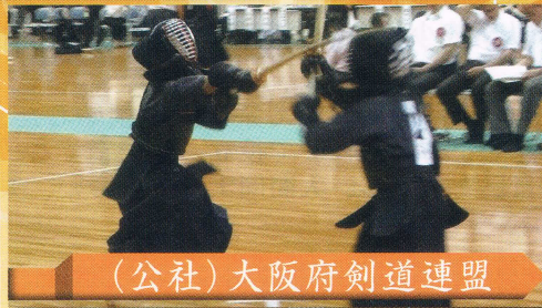
(公社)大阪府剣道連盟