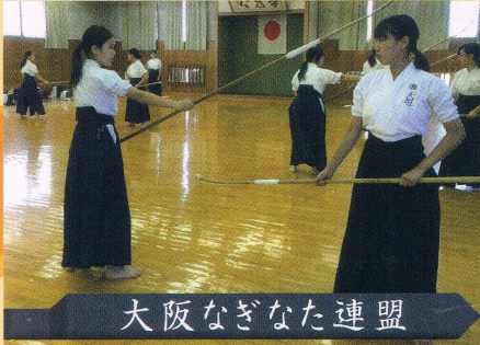
大阪なぎなた連盟