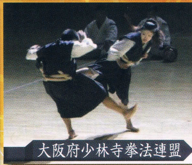
大阪府少林寺拳法連盟