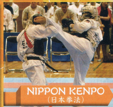
NIPPON KENPO (日本拳法)