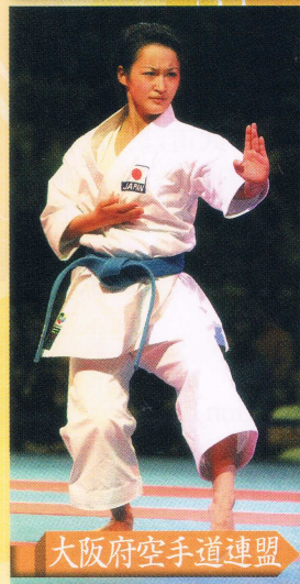
大阪府空手道連盟