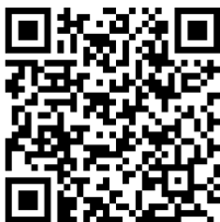
全空連マイページ QR コード

※令和 5 年 4 月 1 日現在で 10 歳未満の者はいかなる場合も出場を認めない。